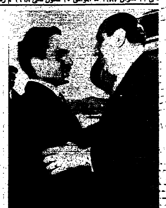
الحسين يعانق فخامة الرئيس شارل حلو في مطار عمان

عمان - استقبل الأردن فخامة الرئيس شارل حلو رئيس الجمهورية اللبنانية الشقيقة في زيارة رسمية تستغرق يومين تلبية للدعوة التي وجهها المملكة الملك الحسين المعظم . وقد جرى للرئيس حلو استقبال رسمي وشعبي حافل وكان على رأس مستقبلي فخامته في مطار عمان المنسي جلالة الملك المعظم وسمو ولي العهد وجمع كبير من رجالات البلاد . الاستقبال الشعبي كما استقبلت فخامة الرئيس اللبناني جموع حاشدة من أبناء الشعب الذين تبادوا إلى المطار رغم البرد القارس وانظفوا على امتداد الطريق المؤدي إلى قصر الحسينية ترحيبا كبيرا من قبل الوف المواطنين الذين خرجوا لاستقباله في مطار عمان المنسي . اجتمع الحامين وحلو ساعين تفاهم على العمل ليعرفه بلشرك عمان - عقد في الساعة الرابعة بعد ظهر امس اجتماع في قصر بسمان بين فخامة شارل حلو رئيس الجمهورية اللبنانية وجلالة الملك الحسين المعظم ملك المملكة الأردنية الهاشمية . وقد ضم هذا الاجتماع من الجانب اللبناني السيد رشيد كرامي رئيس الوزراء والكفور جورج حكيم وزير الخارجية والسفير السيد علي بزي والسيد الياس بركس مدير عام وزارة الخارجية وأحمد الركن أحمد الحاج . ومن الجانب الأردني صاحب السمو الملكي الأمير حسن ولي العهد المعظم